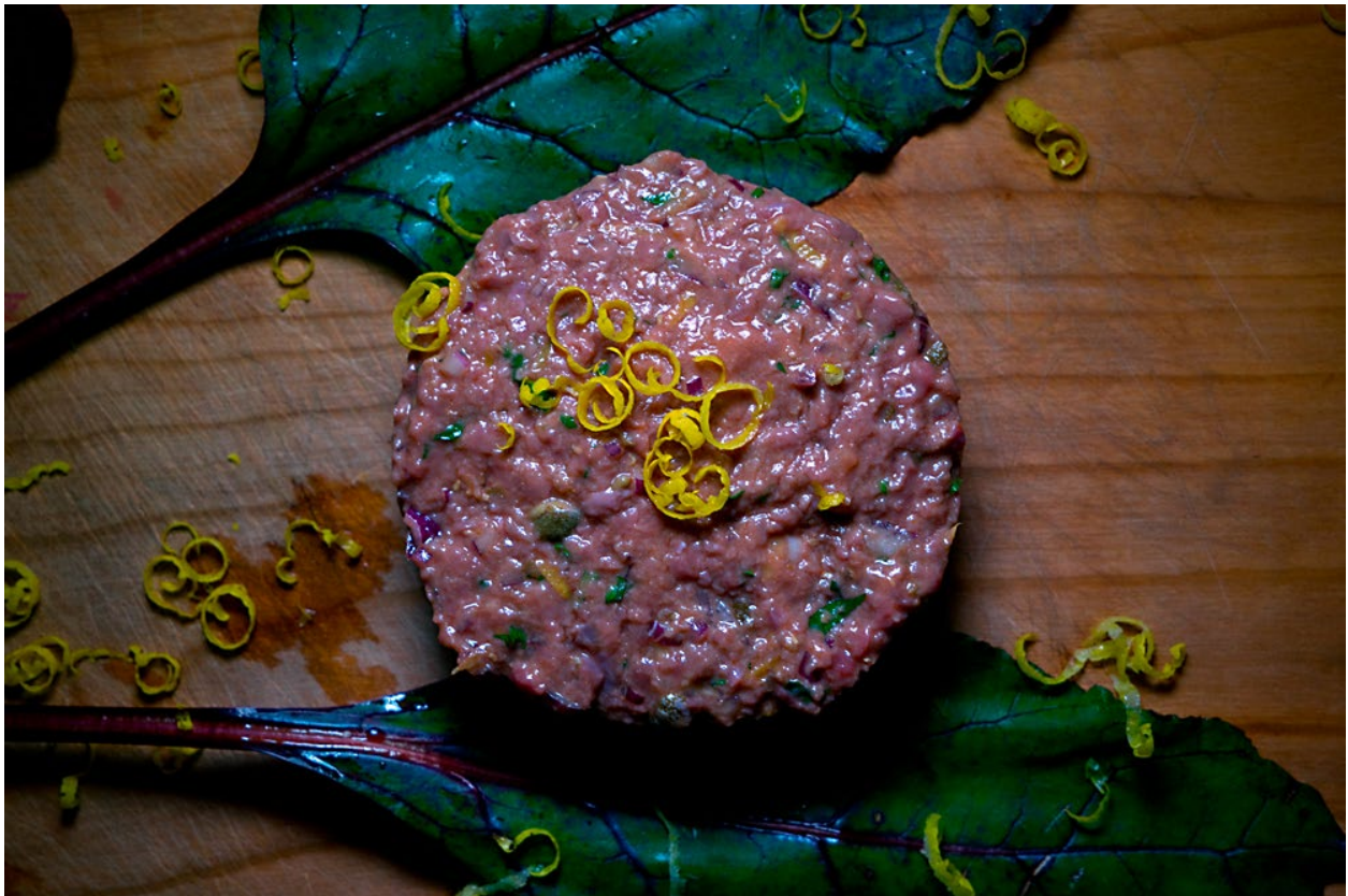
Dieses Tartar kommt von Herzen und stellt eine überaus zarte und erfrischenden Vorspeise dar. (Zürich, 5/2014)