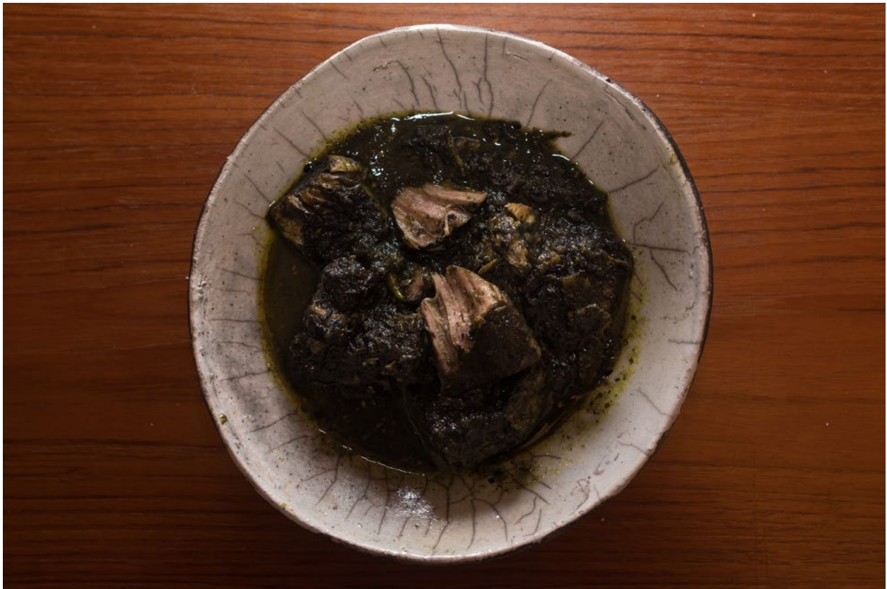
Tiefschwarz mit grünlichem Schimmer, mild und doch hocharomatisch: Schweinefleisch mit Sesam. (Zürich, 3/2018)