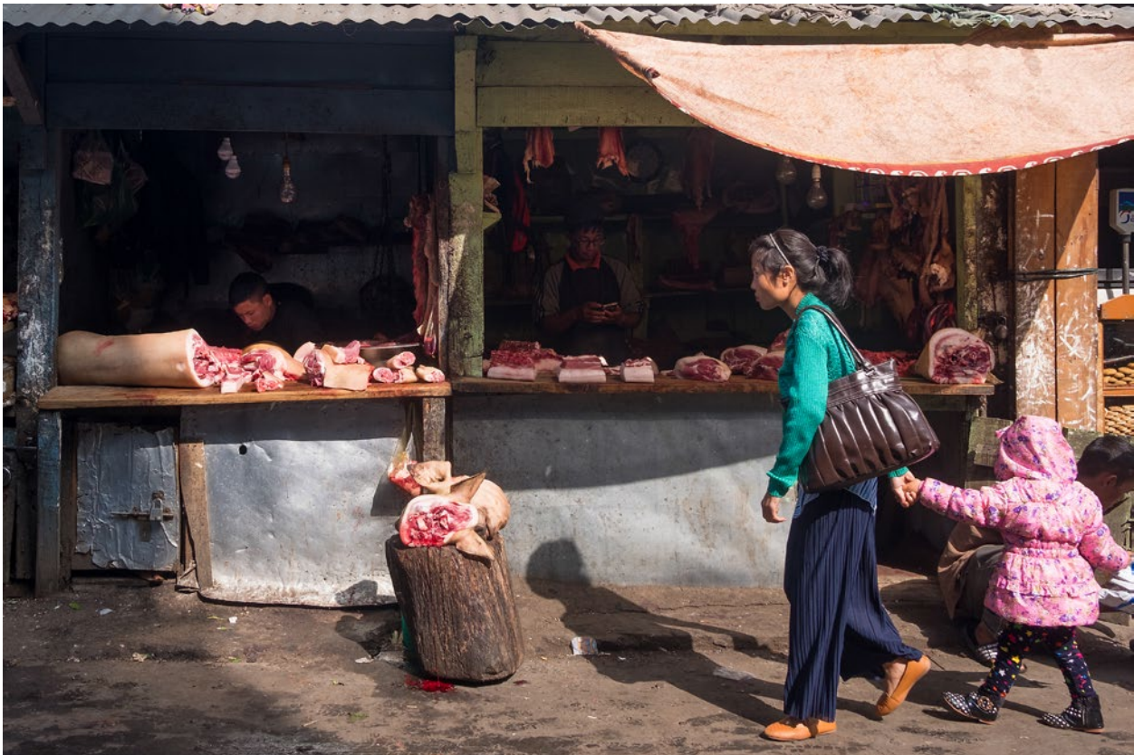
Frisch geschlachtet – auf Schweinefleisch spezialisierte Metzgereien im Zentrum von Shillong. (1/2018)

Konsistenz der Sauce | Wie flüssig respektive dicklich die Sauce gegen Ende der Kochzeit ist, hängt in erster Linie vom Topf ab. Bei schlecht schließenden Töpfen muss man unter Umständen ab und zu etwas Wasser nachgießen. Bei sehr gut schließenden Töpfen, die alle verdampfte Flüssigkeit ständig wieder ins Ragout zurückführen, kann es sich umgekehrt empfehlen, den Deckel schon etwa 20 Minuten vor Ende der Kochzeit abzunehmen.