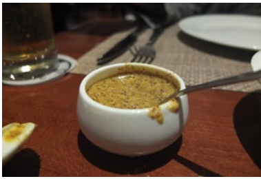
Im Restaurant Oh! Calcutta in Kolkata steht stets ein kleines Schälchen mit Kasundi auf dem Tisch. (3/2012)