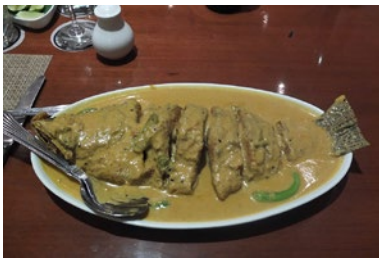
Im Oh! Calcutta wird auch viel mit Kasundi gekocht – zum Beispiel schwimmt dieser Fisch (ein Bekti) in einem See aus Senfsauce.