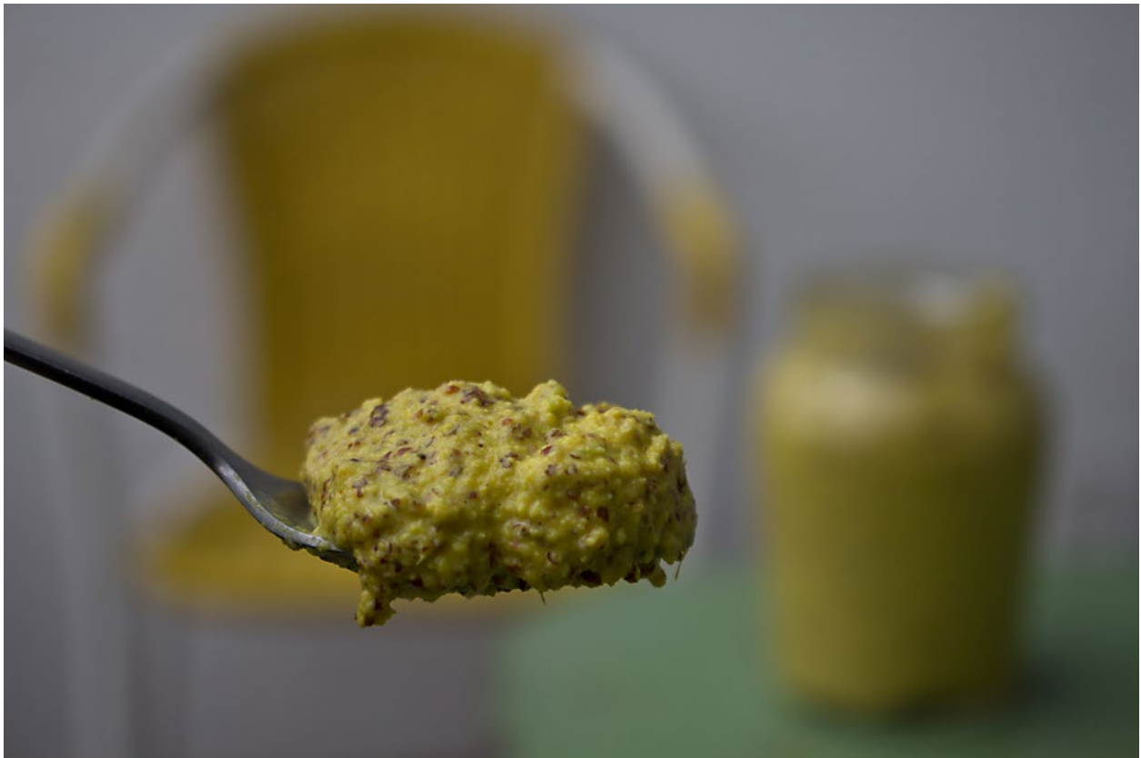
Kasundi schmeckt warm, süß und ein wenig wild, mit markanten Haselnuss-und Fruchtnoten. (Basel, 5/2013)