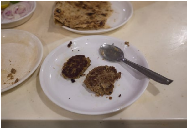
Lammfleisch zart wie Brät, mit Pfeffer, Nelken, Muskat, Kardamom und einem Hauch Rosenwasser: Kakori .