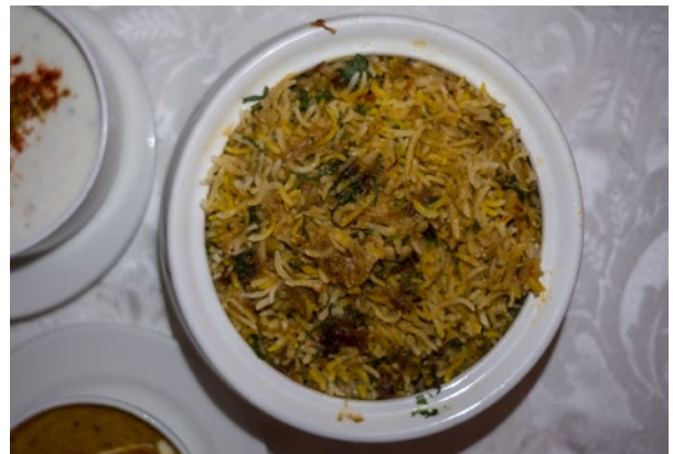
Unter Verschluss im Dampf gegart: Pulao mit Safran und Hühnchen, perfekt zubereitet im Oudhyana in Lucknow.