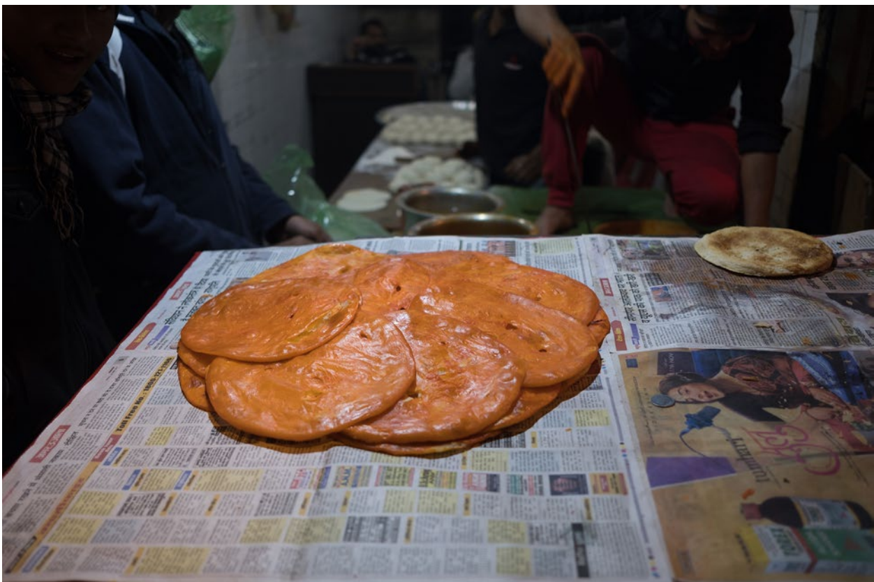
Für Sheermal wird Milch statt Wasser verarbeitet und am Ende kommt Safran dazu: Bäcker in Lucknow. (1/2018)