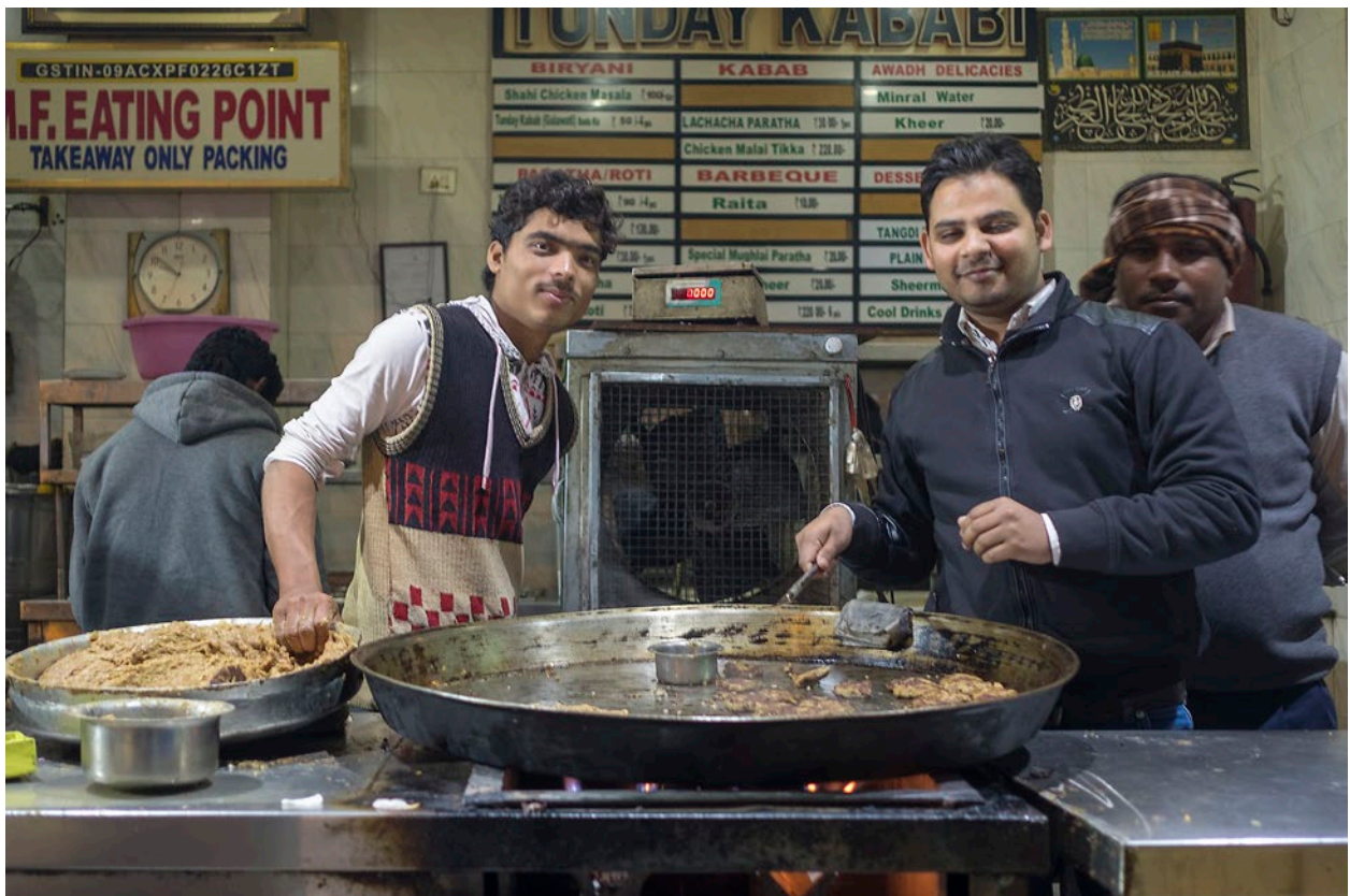
Das gut besuchte Tunday Kebabi gilt als der Ort, wo die besten Kebabs von Lucknow gebraten werden. (1/2018)