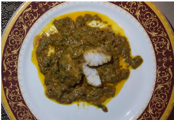
Avadhi machhli im Falaknuma : Fisch in Sauce aus Cashewnüssen, Tomaten, Zwiebeln, Kardamom und Safran.