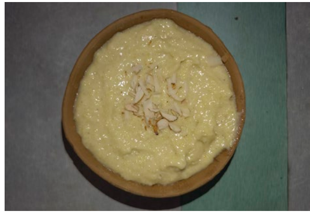
Kesar phirni: Pudding aus Reis, Milch und Zucker, mit Rosenwasser, grünem Kardamom und etwas Safran.