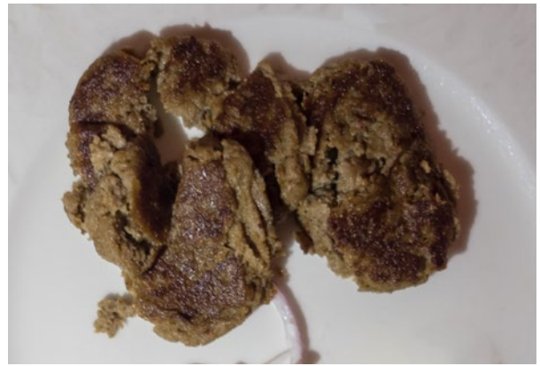
Mit grüner Papaya vermischt und folglich noch weicher und etwas leichter als Kakori : Galawat ke kebab .