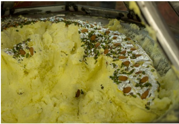
Nimish oder Makkhan heißt der Luftibus unter den Lucknow-Sweets: nichts als Milchschaum und Zucker.