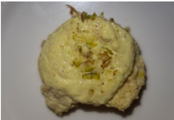
Getoastetes Brot , in Safranmilch eingeweicht, mit Kondensmilch bestrichen: Shahi tukra im Oudhyana.