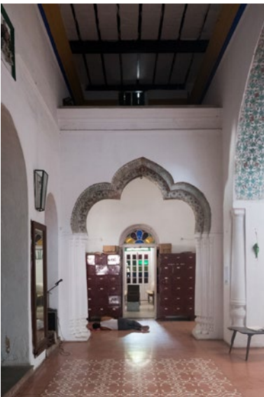
Ein Seitenflügel des großen Nautch Ghar. Im Sommer ist die Hitze in den Ebenen von Bihar so groß, dass man sich für ein Mittagsschläpfchen gerne auf kühle Fliesen legt.