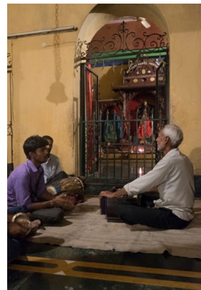
Jeden Abend versammeln sich Musiker vor dem Kali-Schrein und huldigen der Göttin mit Gesang, Trommelrhythmen, Tschinellen und den melancholisch-metallischen Klängen des Indischen Harmoniums – einem kleinen Kasten mit einem Blasebalg, den man von Hand betreibt.