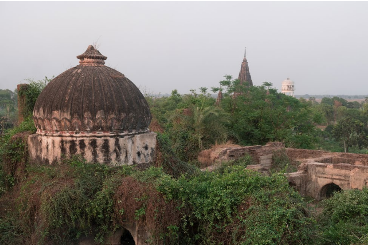
Blick über die Ruinen des großen Palastes von Maksudpur, durch dessen Tore man einst mit Elefanten reiten konnte. Im Hintergrund die Türme des Krishna-Tempels, der noch in Funktion ist. (5/2017)