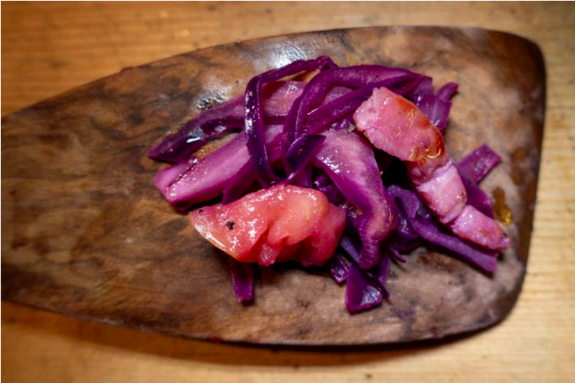
Rotkohl auf französisch-lemusische Manier: Chou rouge aux pommes Sieps . (Basel, 1/2015)