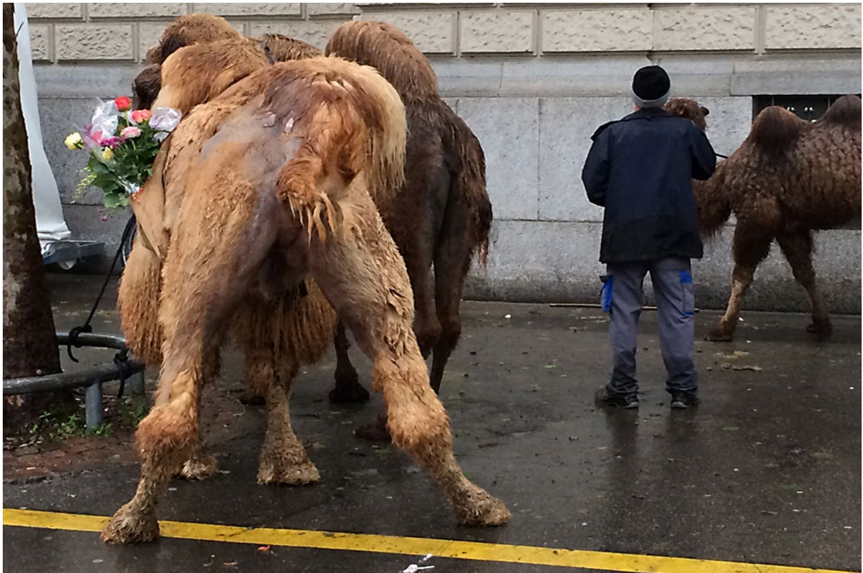
Hinter dem Opernhaus Zürich erwarten Kamele ihren Auftritt am Sechseläuten-Fest. (Montag, 28. April 2014)