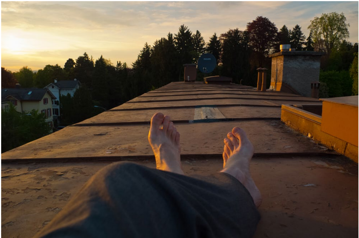
Kann es einen schöneren Ort für eine Weinverkostung geben als mein Dach in Zürich? (Dienstag, 22. April 2014)