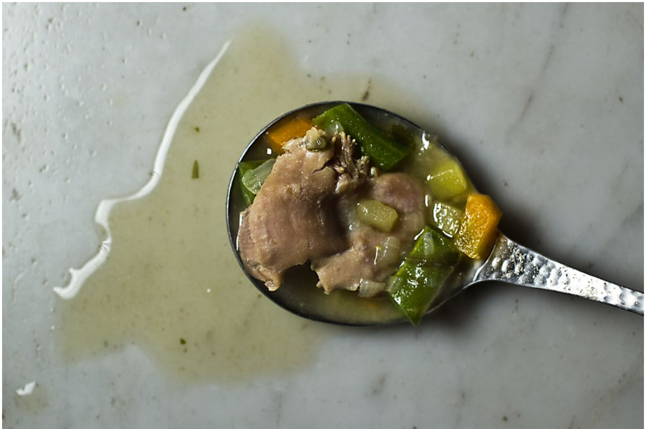
Die Hühnermagen-Estragon-Suppe verströmt einen etwas altmodischen, leicht medizinischen Duft. (Zürich, 11/2013)