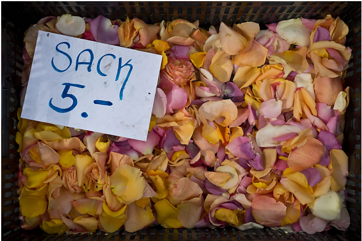
Die Welt der Dinge und die Welt der Worte: Kiste neben Marktstand auf dem Zürcher Bürkleplatz. (Dienstag, 6. Mai 2014)