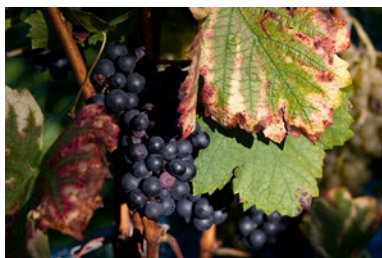
Blaufränkisch im Sortengarten der Hochschule Wädenswil auf der Halbinsel Au im Zürichsee. (10/2013)

Von Flasche zu Flasche ist ein Tagebuchprojekt von Samuel Herzog, das am 29. Juni 2013 seinen Anfang genommen hat. Es geht dabei nicht um eine fundierte Auseinandersetzung mit dem Thema Wein, sondern um eine Form von Trinken, die sich ebenso auf den Wein konzentriert wie auf das, was dessen Wahrnehmung konditioniert – die Erlebnisse und Gedanken des jeweiligen Tages.