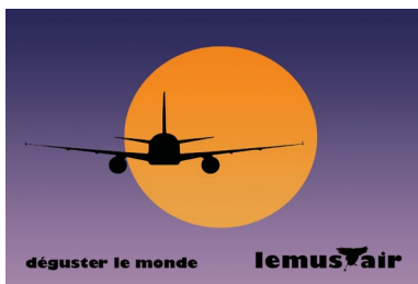
Die Welt verkosten: Werbepostkarte der nationalen Fluggesellschaft.