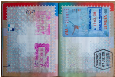
Natürlich braucht, wer die Insel bereisen will, auch ein Visum.