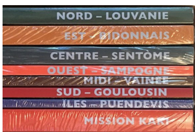
Seit 2020 ist Lemusa auch in sieben gedruckten Bänden dokumentiert.

kleinen Dosen kaufen, in seiner Küche aufstellen und verwenden. Die Etiketten erzählen mittels Bild, Landkarte und Text von dem Ort, der die jeweilige Spezialität produziert. Diese Gewürzdosen stellen für mich (und hoffentlich auch für Dritte) eine Art Minifenster dar, das aus der Realität der eigenen vier Wände in die Welt von Lemusa führt. Zu allen Gewürzen gibt es spezielle Kochrezepte, die Nase und Gaumen eine Vorstellung von den diversen Regionen der Insel vermitteln.