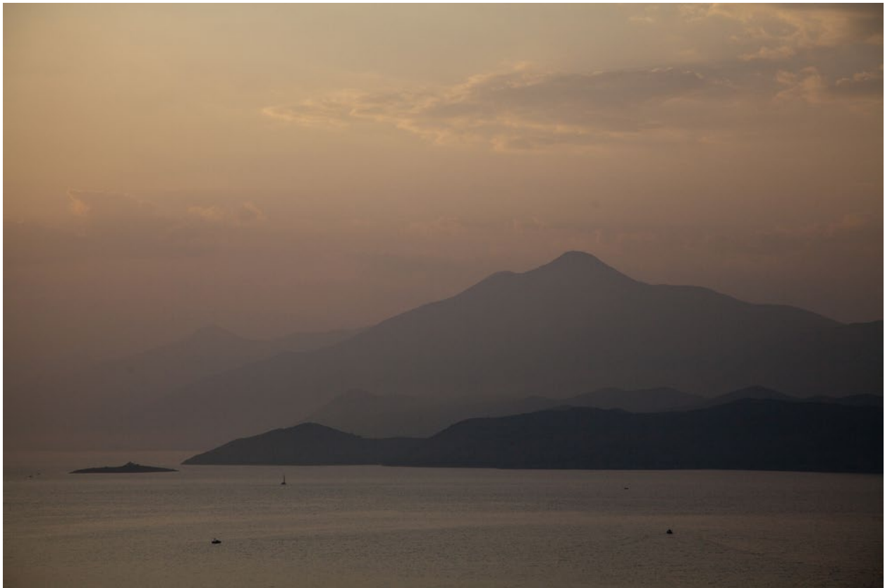
Blick von Osten (Höhe Angeval) auf Lemusa: rechts der Mont Kara, links dahinter die Spitze des Mont Déboulé.